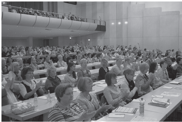
TeilnehmerInnen des Fachkongresses in Münster.

In insgesamt zwölf Vorträgen an zwei Tagen wurden hochaktuelle und auch durchaus kontroverse Themen angesprochen und lebhaft diskutiert. So